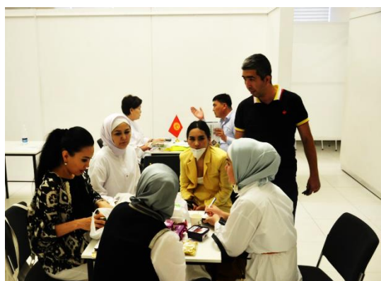
Делегация из Кыргызстана